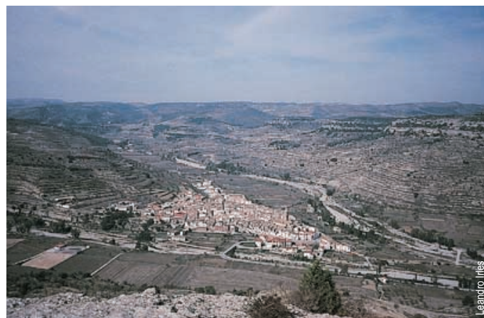
Vista del Forcall