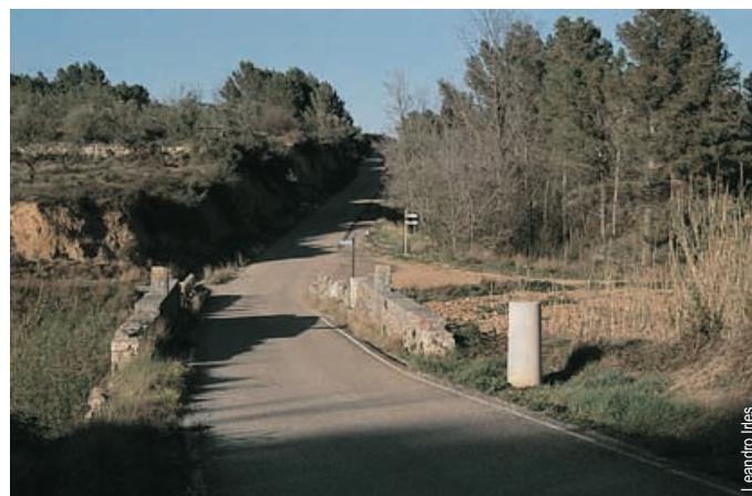
Font de la Coma, Vía Augusta, Sant Mateu