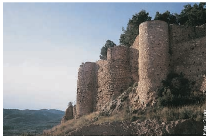
Castillo de Onda