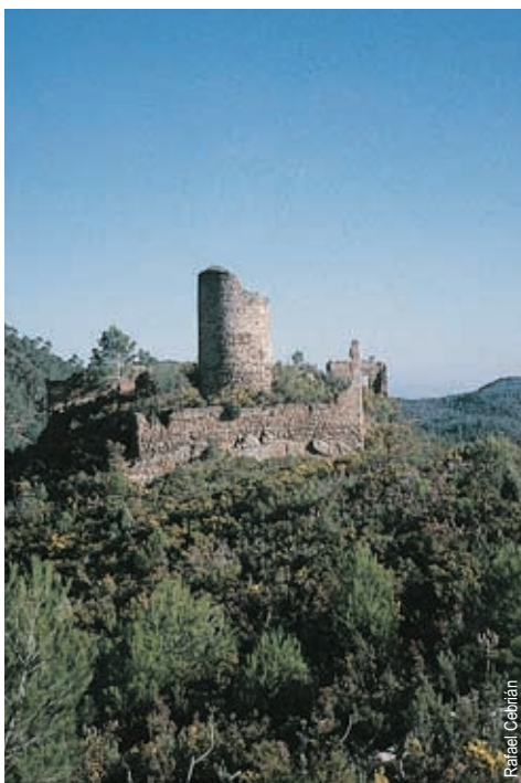
Castillo de Aín