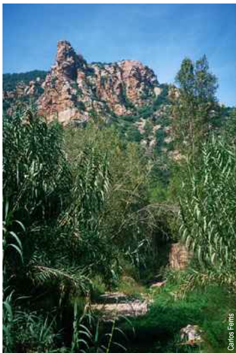
Organos de Benitandús

comarca: La Plana Baixa recorrido: 10'9 km tiempo: 2 h 30' difficultad: baja cartografía: 1:50000 Segorbe 640 (29-25) entidad promotora: Societat d'Amics de la Serra d'Espadà