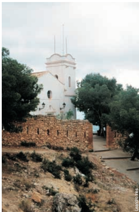
Ermita de San Cristóbal

entidad promotora: Ayuntamiento de Alcora