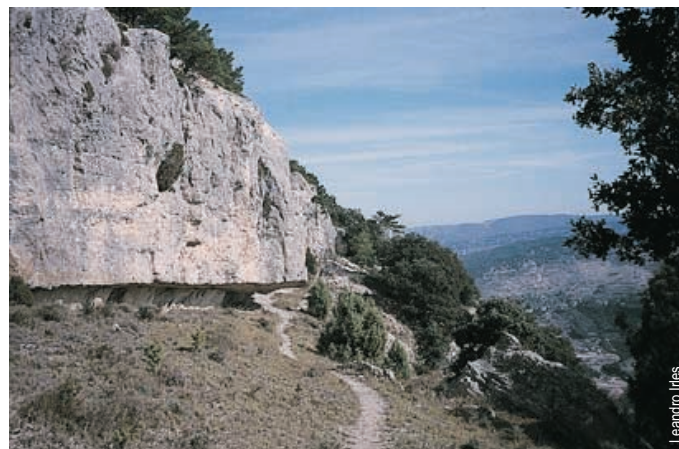
Mola de la Garumba