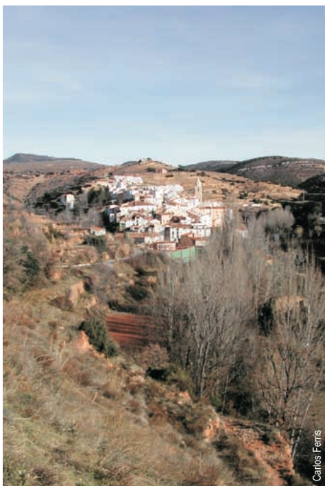
Vista de Cortes de Arenoso

entidad promotora: Ayto. de Cortes de Arenoso