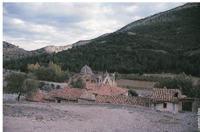
Santuario de la Virgen de la Estrella