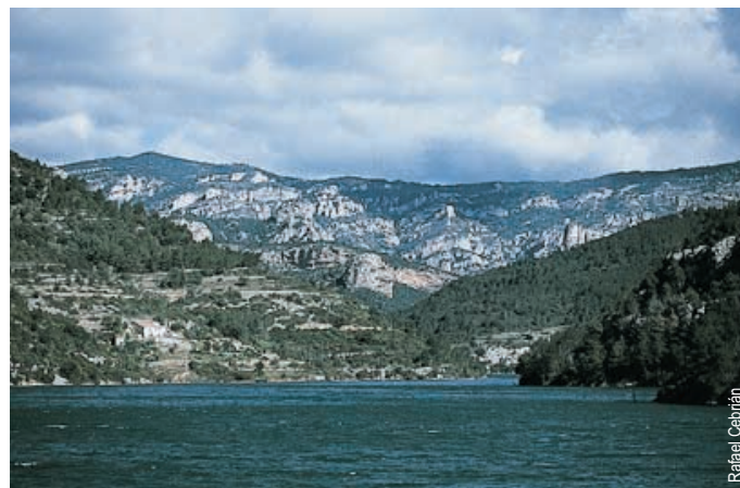
Embalse de Ulldecona