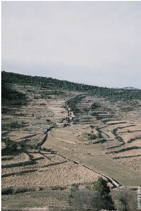
Assegador a Coratxà

entidad promotora: Centro Excursionista de Castellón