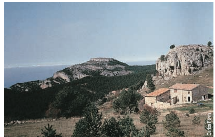
Tossal de Marinet