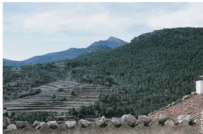
vista de Penyagolosa desde Xodos