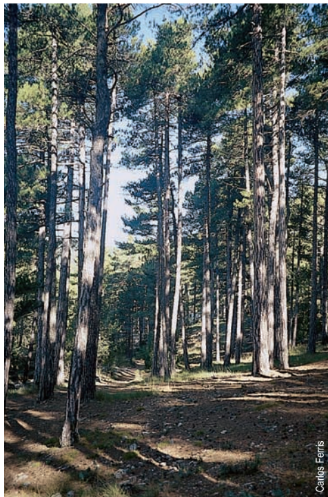
Bosque de Penyagolosa

entidad promotora: Centro Excursionista de Castellón