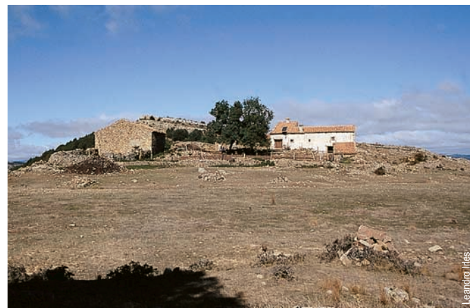
Mas de Cambreta