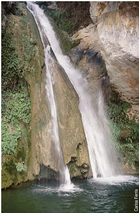
Cascada del Carbo

comarca: L'Alcalatén recorrido: 11'5 km tiempo: 3 h dificultad: media cartografía: 1:50000 Villahermosa del Río 592 (29-23) entidad promotora: Centro Excursionista de Castellón