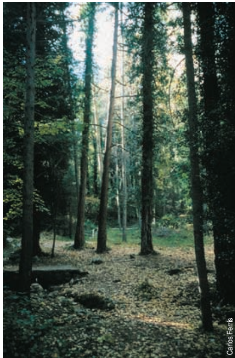
Fuente de la Pegunta, Vistabella del Maestrat

comarca: L'Alcalatén recorrido: 12 km tiempo: 3 h 15' difficultad: alta cartografía: 1:50000 Villahermosa del Río 592 (29-23) entidad promotora: Centro Excursionista de Castellón