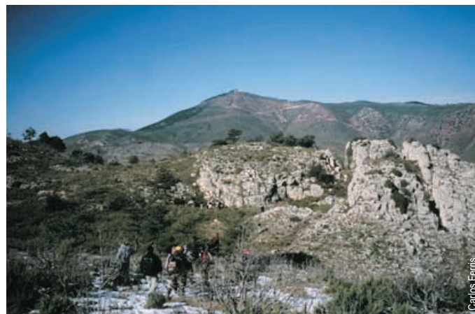
Sierra Cerdaña y el pico de Santa Bárbara de Pina de Montalgrao