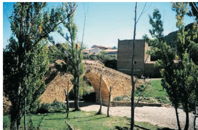
Puente de Sant Miquel de la Pobra del Bellestar