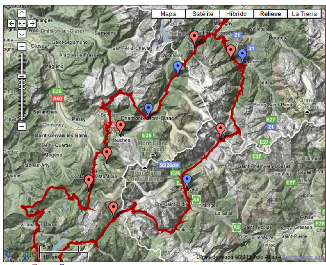
Legenda: Etapa - Waypoint