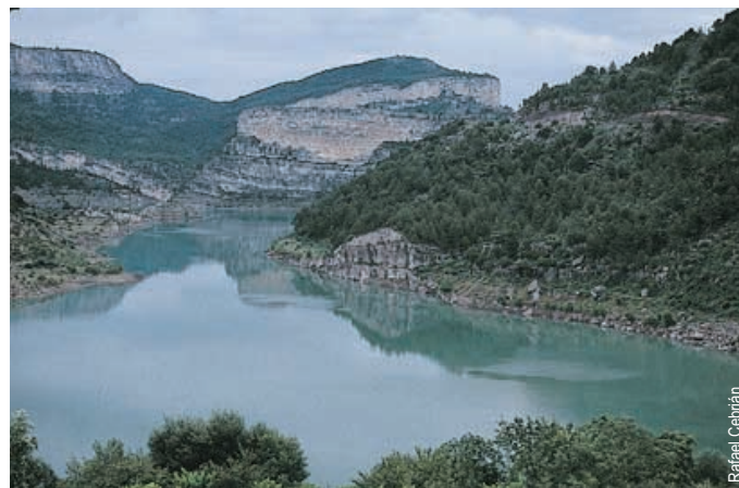
Embalse de Arenoso