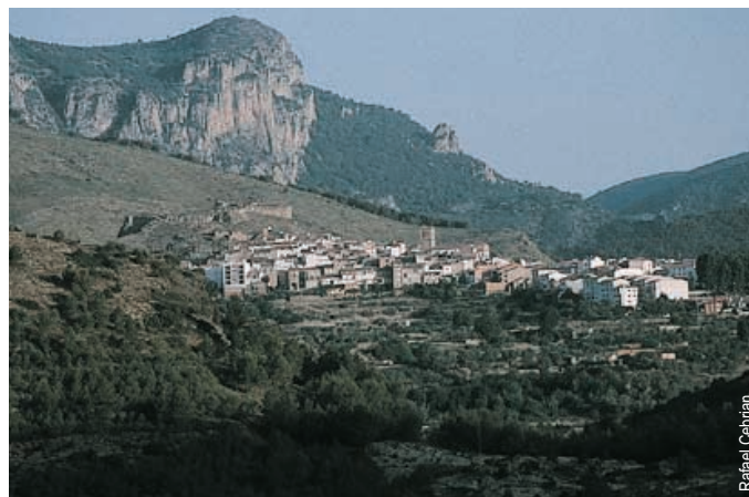
Bejís y Peñasabia