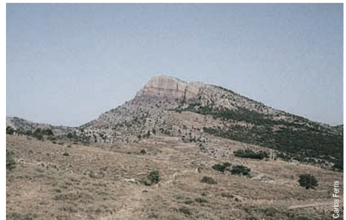
Cima de Penyagolosa