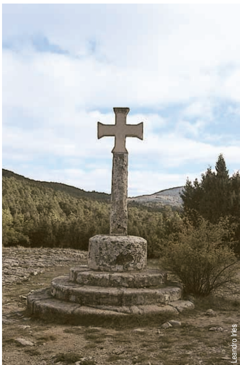
Peiró de Sant Joan de Penyagolosa

entidad promotora: Centro Excursionista de Castellón