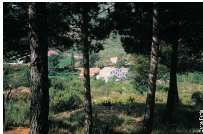
el Mas de Noguera, Caudiel